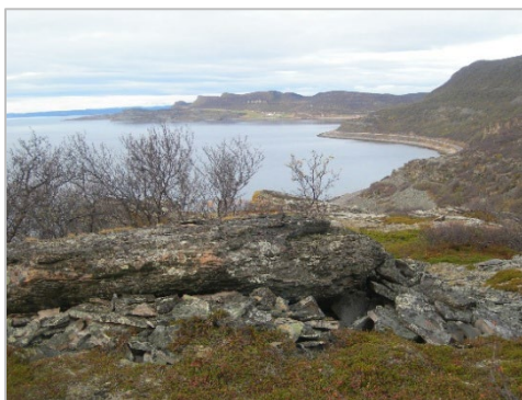
Govus 1. Nu gohčoduvvon " Juovvahávdđit " gávdnojit iešguđetge hámiin ja báikkiin; jábmi biddjojuvvui juvvii gedggiid vuollái, báktelatnji, geađgeborrii, dahje čihkosii gállu gurrii, ja muhtomin ráhkaduvvui čielga hávdehuksehus dahje bordojuvvui geađgeguha jábmi nala.