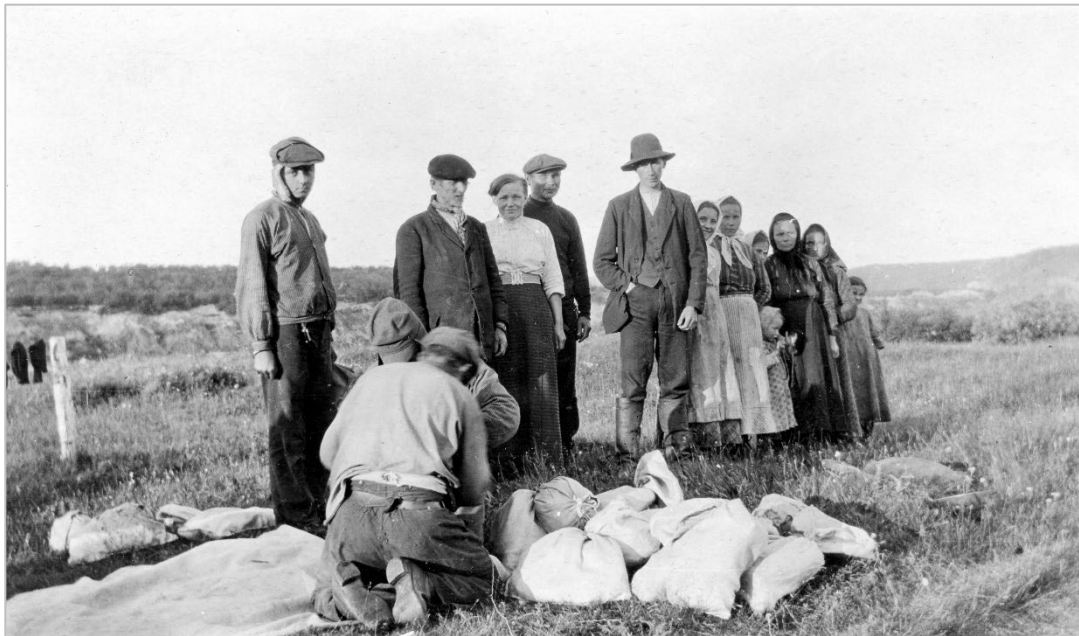
Govus 4. Olbmobázahusaid roggan Njávdamis 1915. Govva: Johan Brun 1915, Norgga árkatalaš universitehtamusea.

BAS-čaokkáldagas leat olbmobázahusat sihke ovdal kristtalašvuoda áiggis ja kristtalaš hávddiin. Dat čohkkejuvvojedje áigodagas 1850-1977. Eatnasiid leat doaktárat ja doavttirstudeanttat čohkken girkogárddiin áigodagas 1914-1940 Emil Schreiner prográmma olis, man ulbmil lei guorahallat fysalaš anatomiija Norggas. Báikkálaš olbmot vuorjašuvve ja vuosttaldedje nállebiologalaš dutkama ja olbmobázahusaid viežžama sámi guovlluin. Schreiner lei gal ožžon lobi Girkodepartemeanttas, muhto báikkálaš sámi álbmogis ii jearran oktage, ja sii vuosttaldedje mángga geardde. Bázahusaid čohkken 1800-logus ja álggogeahčen 1900-logu čađahuvvui dalá olmmošoainnu ja dakkár jáhku vuodul ahte iešguđet olmmoščearddaid gaskka lei evolušuvnnalaš hierarkiija, ja ahte sii nappo gullet iešguđet árvodássái. Dalá eiseválddiid ja dutkiid berošmeahttun oaidnu ja vuohki guđii eahpeluohttámuša, traumaid ja háviid, mat olu sámi báikkálaš servodagain eai leat vel odne ge savvon. Dát ferte vuhtii válđojuvvot go ráhkaduvvojit njuolggadusat daid olbmobázahusaid boahttevaš hálddašeapmái, maid BAS ain odne vurkkoda.