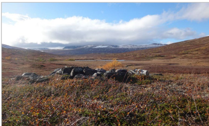
Govus 2. Bivdoeananhávdi (fangstmarksgrav)

Lullelis ja sámi siseatnamiin gávdnojit ng. vuovde- ja jávrehávddit (maiddái gohčoduvvon bivdohávdin, muhto maid mii dás gohčodit bivdoeananhávdin, dárogillii fangstmarksgrav ) maid dovdomearkan leat vuollegis geađgegubat eatnamis, ja nuppe ládje go juovvahávddiin lea dát kremašuvdnahávdádanvuohki, go jábmit lea boldojuvvon. Dasa lassin gávdnojit ovdal kristtalašvuođa áiggi sámi eananhávddit, dábálaččat goike sáttu- ja čievraeatnamis. Muhtimiid nalde leat čielga geađgegubat, ja earát fas eai leat merkejuvvon oinnolaš mearkkain.