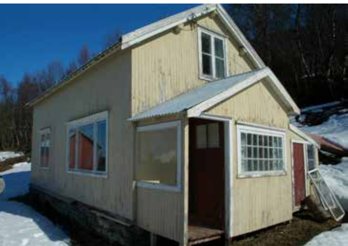
Ássanviessu Gáivuonas. Sierra lohpi addojuvvui ođđaset oasi gaikumii ja ođđa huksemii sadjái. Sierra lohpi guoská maiddá eará rievdadusaide robis, rohperenniid, váldobealkkaid, isolašuvnna ja biippu divvumii, ja muhtun ođđa glásaid molsumii.

Dađistaga bajásdoallamii, nugo robi divvut seammalágan ávdnasiiguin, čihhtet glásaid, málet seamma ivnniin ja málain jna., ii dárbbas ohcat lobi.