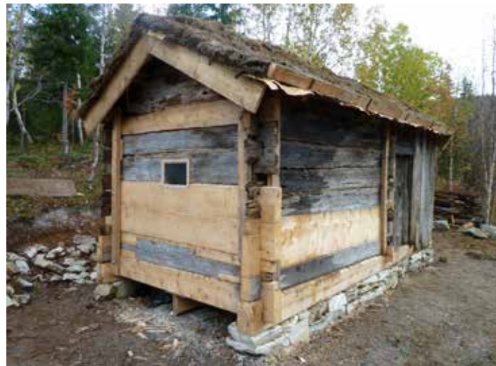
Ol'Andersen buvri Hemnes nammasaš báikkis. Sierra lohpi addojuvvui sirdit buvri eanet guovddáš báikái ovdal divvuma. Gáibiduvvo ahte buvri ferte duodaštit ja divvut antikváralaš prinsih- paid mielde.

Dieđihan- dahje huksenohcan sáddejuvvo ovtta sierralohpeohcamiin gildii. Dat sádde fas ohcama viidáseappot Sámedig- gái dan meannudeapmái kulturmuitalága mielde