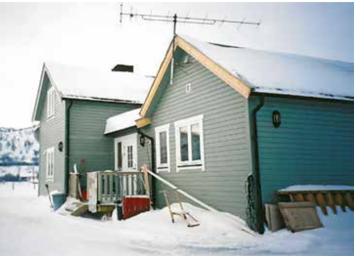
Ássanviessu Deanus. Sierra viiddidanlohpi juolluduvvui. Sámedikki bagadusa mielde ráhkaduvvui plána viiddideami várás. Riikaantikvára attii sierra lobi ja gáibidii ahte plána čuvvojuvvo

Kulturमितolága váldoprinsihppa automáhtalaččat ráfáiduhttimis lea ahte vistti ii leat lohpi rievdadit dainna lágiin ahte billistivččii kulturmuittu. Dat mearkaša dan ahte rievdadusaid ferte dahkat várrugasat ja vistti árvvus atnimiin.