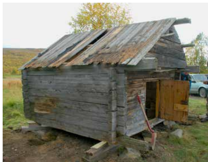
Áitti ođasteapmi Deanus