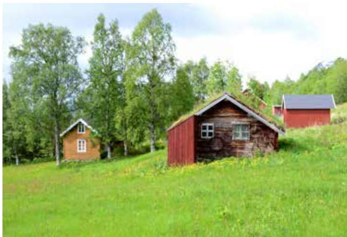
Elvebakken gård Báhccavuonas

Go vistti hápmi, konstrukšuvdna, ávnnasgeavaheapmi, olgošdikšun, geavaheapmi dahje birasoktavuohta leat rievdaduvvon, de sáhtta dadjat ahte vistti lea veaháš massán álghámis. Ollu okta-