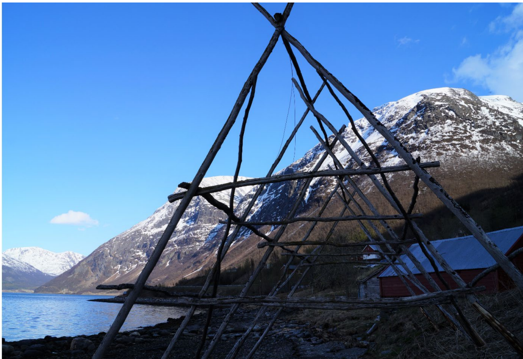
Jielli Skárfvággi, Gáivuotna, Romsa /Skardalen, Kåfjord, Troms.