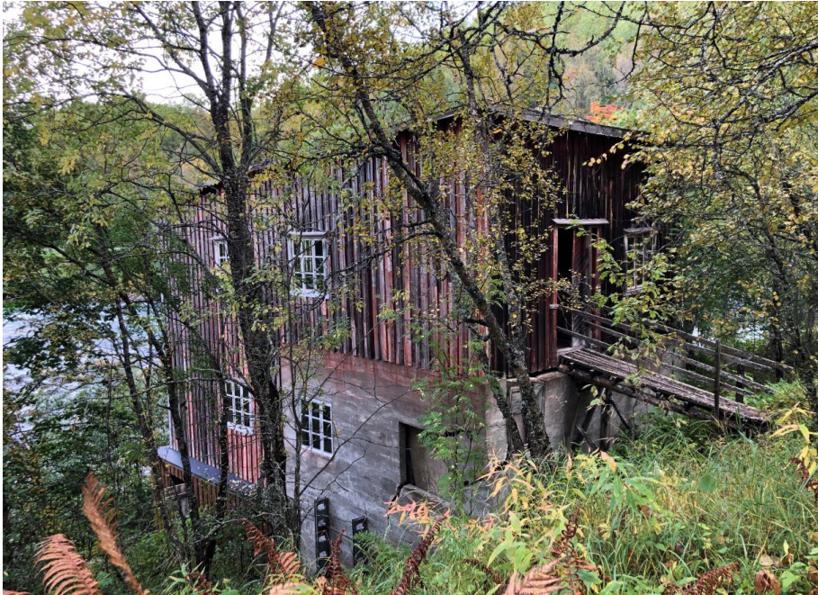
Millo, Rivtták, Romsa.