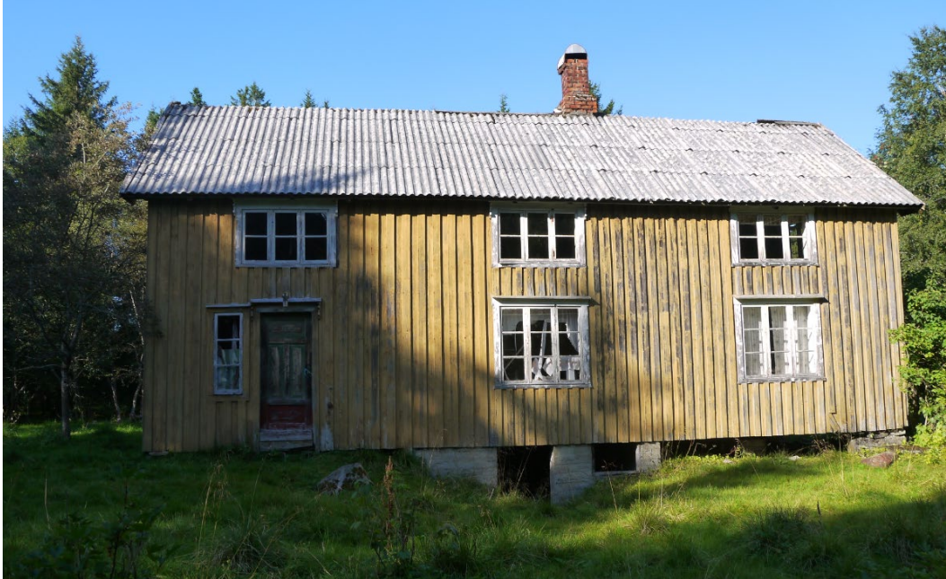
Viessu, Breivold, Åfjord, Tröndelage/Trøndelag.

Čuoggás 1.2 govvejuvvon elemeantaid vuodul ja vuoruhuvvon fáddámildosis, leat muhtun guovllut erenoamážit vuoruhuvvon, ja vistekategorijain dáin guovlluin berre leat alla dahje hui alla árvu.