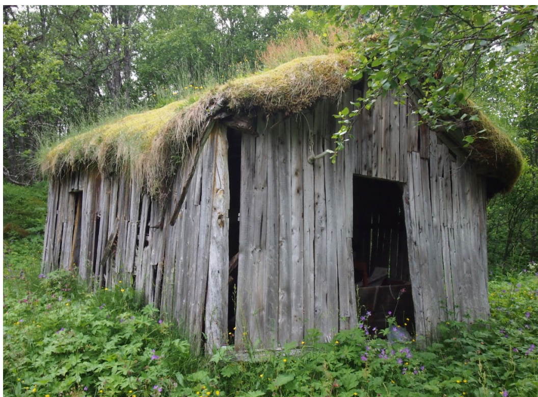
Áiti, Østli, Áhkánjarga, Nordlánda.