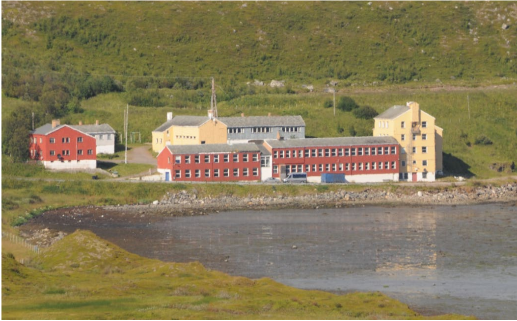
Internáhta Stuuravuonna, Unjárga, Finnmárku/Karlebotn, Nesseby, Finnmark.