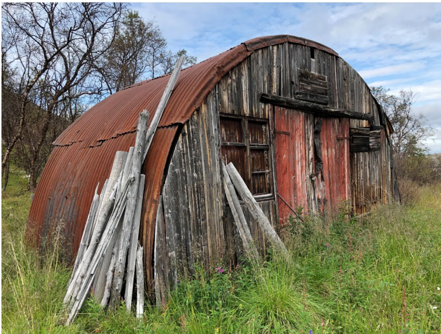
Nissen-bráhkka, Bánkogohppi, Unjárga, Finnmárku

Go eiseválddiid ođđasishuksen álggahuvvui, de gaikojuvvo dát visttit dahje adnoje liige viessun dahje áitin. Dađi bahábut eai gávdno šat galle dákkára, eat ge mii dieđe galle gávdnojit, gos dat leat, makkár dilis dat leat eat ge man jođánit dat jávket. Dát leat visttit main lea alla kulturhistorjjálaš árvu ja mat čájehit makkár orrundilit ledje vuosttaš ođđasishuksema áiggi.