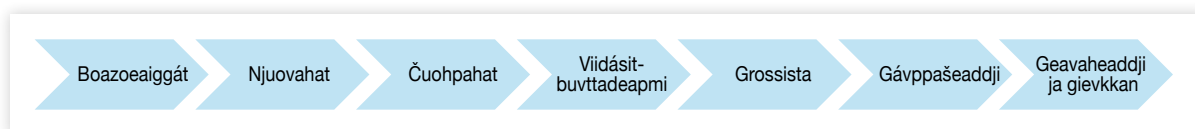
Govus 2. Árvoráiddu ovdanbuktin bohccobiergu ektui

Bohccobiergu árvoráiddu sáhtta govviduvvot ná: