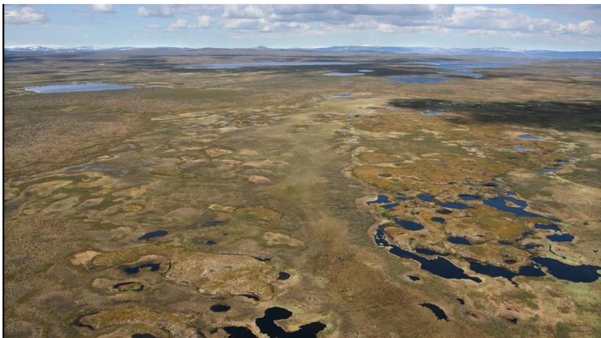
Figur 4. Myrer ved Gohteluoppal i Kautokeino som ikke ble vernet

Lokale samiske interesser i Tysfjord-Hellemobotn klarte å omdefinere en verneprosess til å bygge på samiske premisser. Noe tilsvarende ble utredet for utvidelse av Øvre Ánarjohka nasjonalpark og etablering av Gohteluoppal nasjonalpark i Kautokeino som utvidelse av Reisa nasjonalpark, men Regjeringa skrinla alle disse planene i 2015. 6 For de to forslagene i Finnmark kan dette skyldes at forslagene fra Fylkesmannen gikk relativt langt i å imøtekomme samiske lokalsamfunns interesser i å ivareta kulturbasert høsting og dermed godta mer lempelige motorferdselsregler (Riseth m.fl. 2010a, 2010b, Riseth 2016).