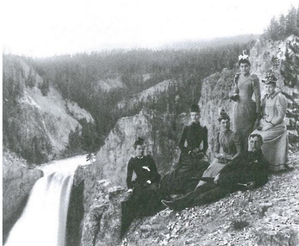
Figur 1. Besøkende i Yosemite nasjonalpark 1890 (Foto: Geoffrey C.Ward 1996:328).

Det foreligger en rekke studier som bekrefter et slikt bilde basert på erfaringer fra praktisk talt det meste av kloden (Chatty, 1998; Neuman, 1998; Hitchcock, 2002; Poirier & Ostergren 2002; Fearnside, 2003; Nicholas, 2005; Smardon & Faust, 2006). Adams (2003) oppsummerer at fram til 1990-årene var den konvensjonelle betydningen av etablering av nasjonalparker undertrykking av lokalbefolkningens ressursbruk og framtvunget frafall av etablerte rettigheter og mønster for ressursbruk. Denne verneformen ble gjerne omtalt som festningsvern («fortress conservation»).