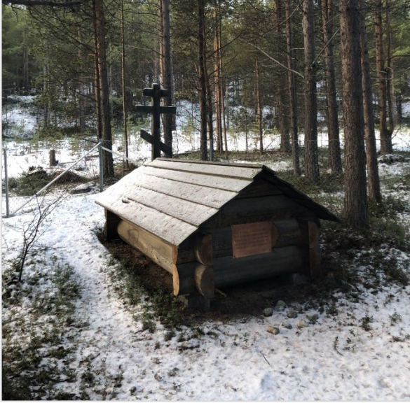
Figuvrra 6. Gálddásáme hávddádimbájkke Bahčaveajjin. Dánna li ádásis hávddáduvvam ulmusjbátsidisá ma jádeduvvin Todd'suel/hávddádimsuollus Bahčaveajjijágás 1950-lágon. Jáhtem dáhpáduváj plánidum tjáhtjedulvvadime aktijvuodan. Valla 21 oajvveskuvre rájaduvvin Universitetet i Oslo ja alla ádásis hávddáduvvam aktan daj nuppij ulmusjbátsidisáj. Dát ássje dálla giehtadaláduvvá Sámedikkes.