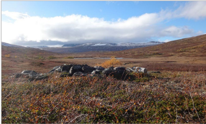
Figuvrra 2. Bivddoednamhávde Gávvá: Sametinget

Duodden gávnnuji aj sáme gudi hávddáduvvin ednama sisi aj risstalasjuoda ávddála, álu gájkas sáttoj- ja sjárraálgij sisi. Nágin bále lij gierggehårre nanna, valla aj ednamhávddádussan mij ittij vuojnu. Gávnnuji aj buojkulvisá gá li guottoj ja gábaduvvam stáhke sisi hávddáduvvam. Ienemus ednamhávddádusá dáhpáduvvin sisednamijn ja várijn. Ij la galla agev navti. Dutkamhistávrálasj faktávrá li dávk aj dási vájkkudam, buojkulvissaj makkir tjuolmajt dutke li dættodam ájges ájggáj ja makkir guovlojs li berustam. Duola dagu li ednamhávddádime merragátten dákkuduvvam dáttja hávdden, madi ádá dutkam vuoset dille lij dávk ienep moattebelak, ja ienep ednamhávddádusá dálla ádásit árvustaláduvvi ja dájdáduvvi sáme hávdden.