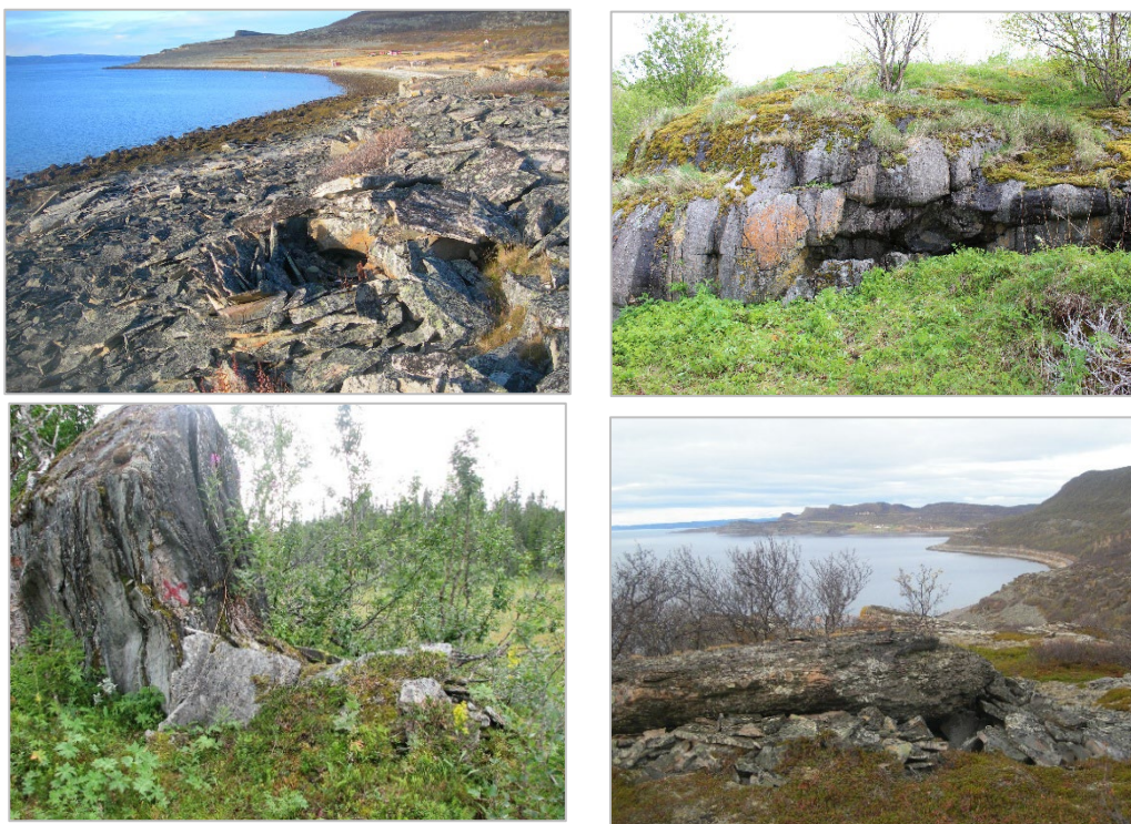
Figuvrra 1. Gåhtjodam “juovvahávde” gávnnui iesjuhtik hámen ja bájken; gånå la juovva, slahpa ja gållo jali tsiekkim. E gávnnu dássju gånå la juovva ja báhko ietjastis máhtå vaddet boasto gåvåv.

Sáme hávde risstalasjuoda ávddåla. Hávddádallamvuohke I viek tjanáduvvam sáme væráltvuojnui ja ásskui. Gávnnui moatte lágásj sáme hávde risstalasjuoda ájge ávddålis. Juovvahávde la aktisasj namma dajda hávdijda ma gullui ienemus dábdos sáme hávddádallamdáhpáj, ja da li dán állu dálutjis. Vuorrasamos sáme bátsidisá ma li bisoduvvam báhti dásj juovvahávdijs, ja vuojnunagi dát hávddádimmvuohke gávnnui juo 900-lågon å.Kr. Jábbmegav álu giessin jali gárrun soahkebiessij sisi ja suv biedjin juovajda, gålojda, gålloj vuolláj ja stuoráp gålloj vuosstij, muhttij lidjin tjielgga hávdekonstruksjåvnå jali gierggehåre aj. Jus lij slædoj sinna de muhttij jábbmegav biedjin gierrisa jali muorragisto sisi – gistoj álggin gasskaájge rájes ávddålijguovlluj. Dát hávddádimmvuohke lij anon dallutij gå risstalasjuohta bádjij Sámeednamij 16/1700-lågon ja nágin sajen unnin 1800-lågo sisi. Návti I dát akta dajs guhkemus doajmme hávddádallamvuogijs majt dábdåp Eurohpån. Juovvahávde gávnnui ienemus sajjin Sámeednamin ja da li akta dajs ájnnaamojs gållojs sáme vássám ájge birra ma mijån li. Nuorttalij-Vuonan gávnnui juovvahávde ienemusát merragåtten, madi Trøndelågan ja Nuorttalij-Svierigin gávnnui ienemusát sisednam- ja várreguovlojn. Nágin gaskav gå rievddagådjij risstalasj hávdijda de hávddádallin jur ednamgierraga vuolen, álu njårgajn ja suollujn, farra gå juovajn.