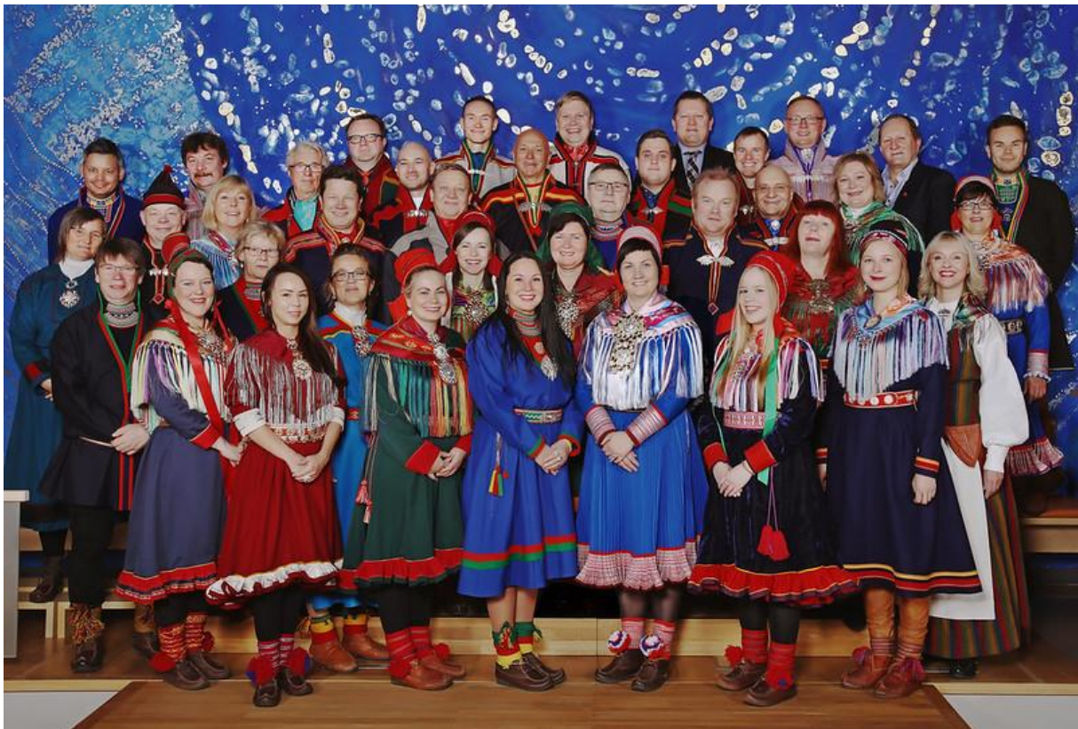
Sámedikki dievasčoahkkin 2017-2021.