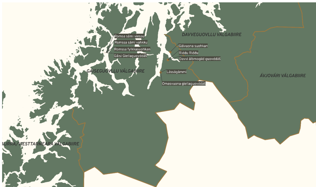
Govus 4 – Sámedikki njuolggadoarjagiid vuostáiváldit Gáiseguovllu válgabiirres