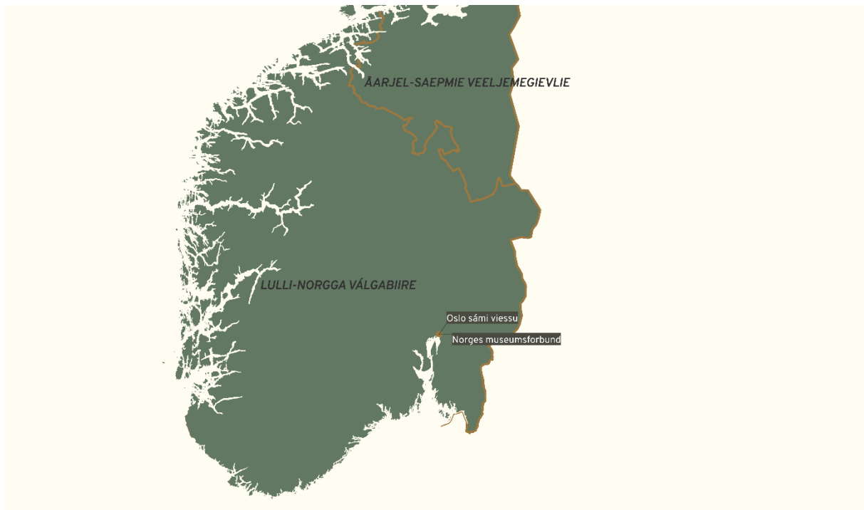
Govus 7 – Sámedikki njuolggadoarjagiid vuostáiváldit Lulli-Norgga válgabiirres