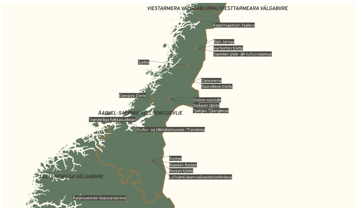
Govus 6 – Sámedikki njulggadoarjagiid vuostáiváldit Årjel-Saepmie veeljemegeivlies

Válgabiirii gullet gielddat Raanen tjielte ja Rávdá suohkana rájes máttás guvlui Nordlándda fylkkas, gielddat Trøndelága fylkkas, Surnadal, Rindal og Sunndal gielddat Møre- ja Romsdal fylkkas ja Eengerdaelie, Rendalen, Os, Tolga, Tynset ja Follidal gielddat Innlandet fylkkas. Válgabiirres leat njeallje giellaovddidangiellada, Aarborte, Raarvihke, Rosse ja Snåase suohkanat, main leat lágas mearriduvvon geatnegasvuodát sámegeala ektui sámelága vuodul. Sámedikkis lea ovttasbargošiehtadus Tråante suohkaniin (2022).